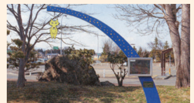
モニュメントとアートスペース

又、「宮澤賢治学会イーハトーブセンター」も30周年を記念して小中高校生の作品を宮澤賢治イーハトーブ館に11/1～12/25(予定)の間、「賢治さんの世界を描く絵画展」として展示します。(広報はなまき4/15より)