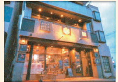
Lit work place

市内のリノベーション事例としては、花巻中央広場でのマルシェやパーティーなどの催し、JR花巻駅東口にある旧民芸品店をビール醸造所兼カフェに改装した「Lit work place」、吹張町の花月堂ビルを改装してシェアキッチン・イベントスペース、建築相談所の開設(予定)、などがあります。